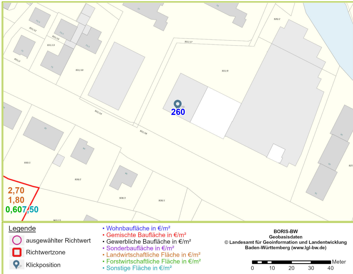
Abbildung 2: zentralisierte Darstellung der Klickposition mit den gewählten Einstellungen von Maßstab und Hintergrundkarte am Bildschirm

Der von Ihnen gewählte Bereich liegt in der Gemeinde/Stadt Schwäbisch Gmünd. Die Darstellung dieses Kartenbereichs kann durch den Anwender individuell beeinflusst werden, z.B. durch Ändern der Klickposition, des Zoommaßstabs oder der Auswahl der Hintergrundkarte.