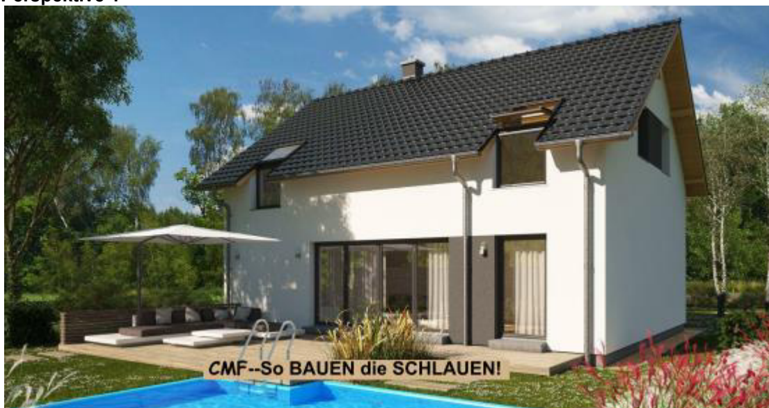
Foto Perspektive 1

— Im Standard einfarbige Putzfassade, Bemusterung nach Farbskala— — Abbildungen zeigen Sonderleistungen —