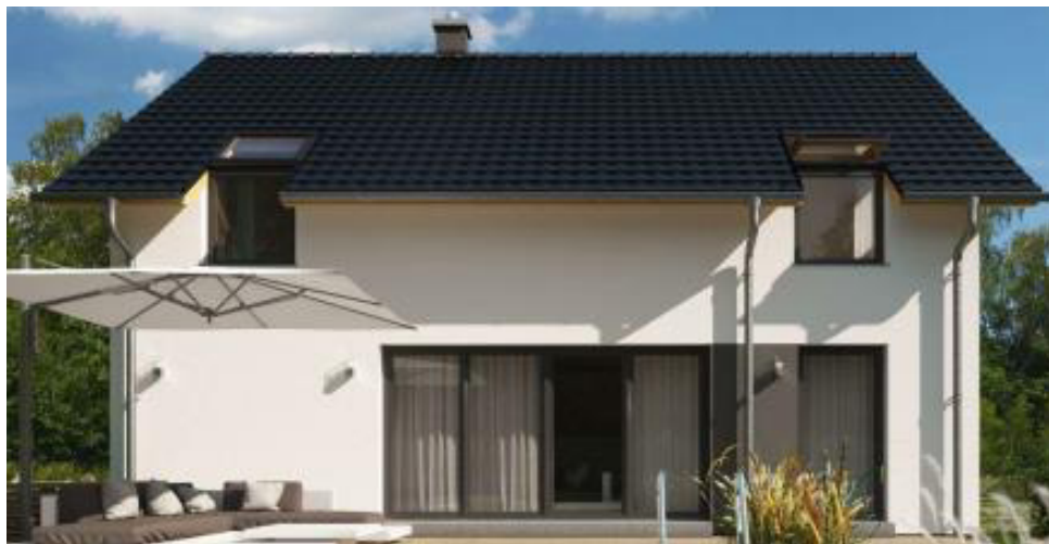
Putzfarbe nach Farbskala