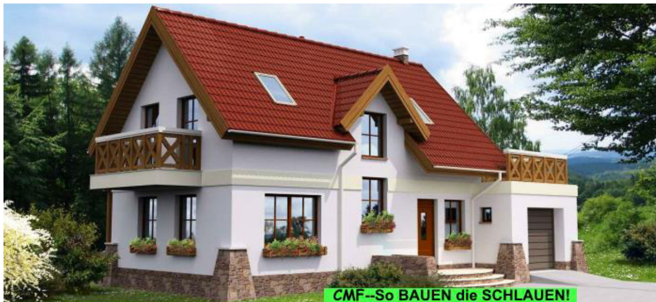
Foto Perspektive 1

— Im Standard einfarbige Putzfassade, Bemusterung nach Farbskala — — Abbildungen zeigen Sonderleistungen —