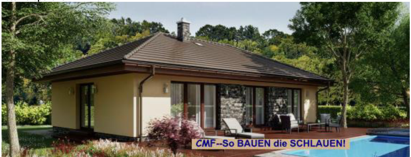
Foto Perspektive 1

— Im Standard einfarbige Putzfassade, Bemusterung nach Farbskala— — Abbildungen zeigen Sonderleistungen —