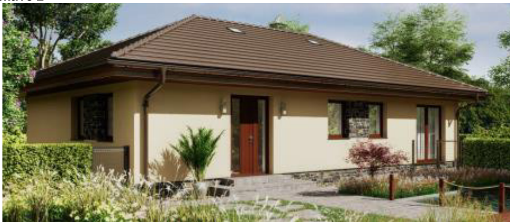
Foto Perspektive 2

— Im Standard einfarbige Putzfassade, Bemusterung nach Farbskala— — Abbildungen zeigen Sonderleistungen —